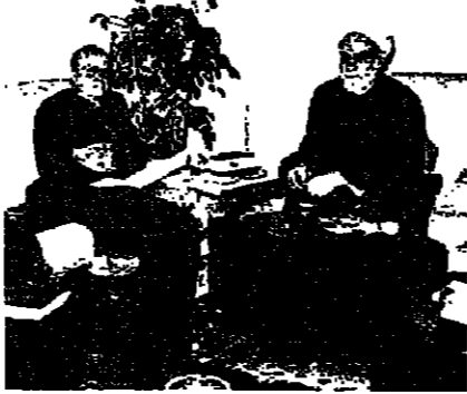
عند شمس الدين